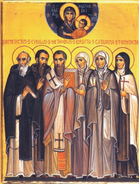
Paolo Orlando - XXI sec.