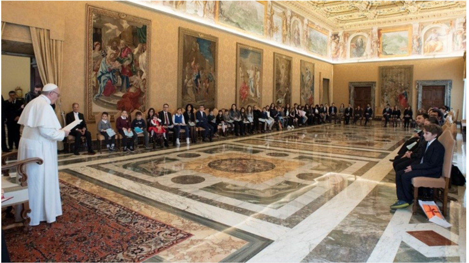
Imagen de archivo correspondiente a la audiencia del Papa a los chicos de la Acción Católica