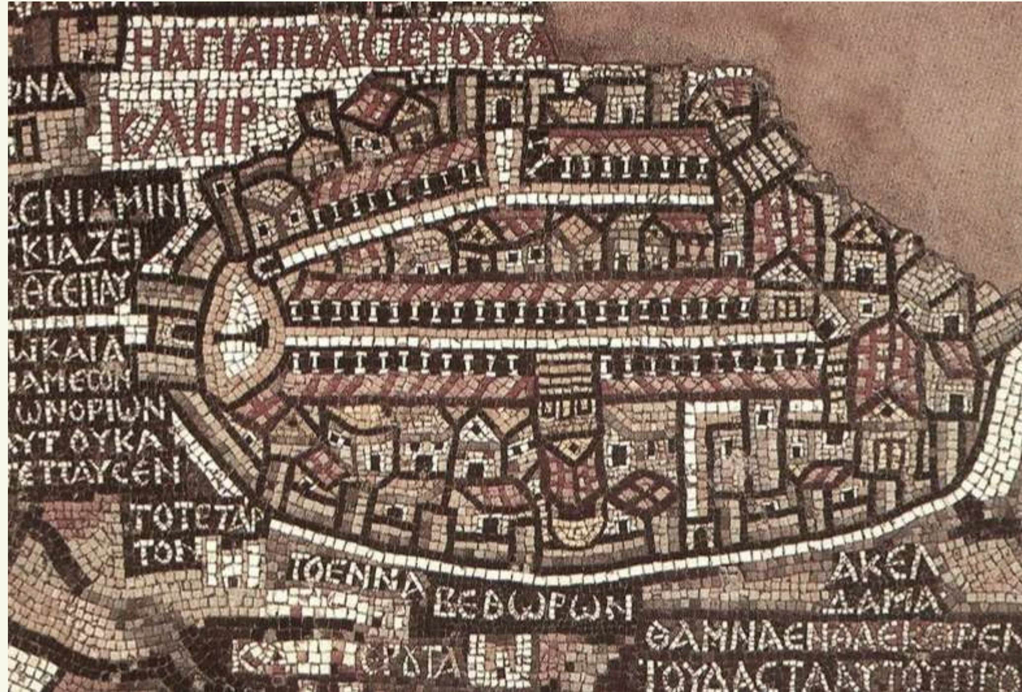
Mappa di Madapa

La preghiera ci educa ad agire. Le limitate possibilità umane si congiungono nella preghiera alle infinite possibilità di Dio. Pensieri, parole e opere infrangono, allora, la demoniaca catena del male e si mettono a servizio del Regno di Dio: un Regno in cui non c'è spada, né drone, né vendetta, né banalizzazione del male, né ingiusto profitto, ma solo dignità, comprensione, perdono.